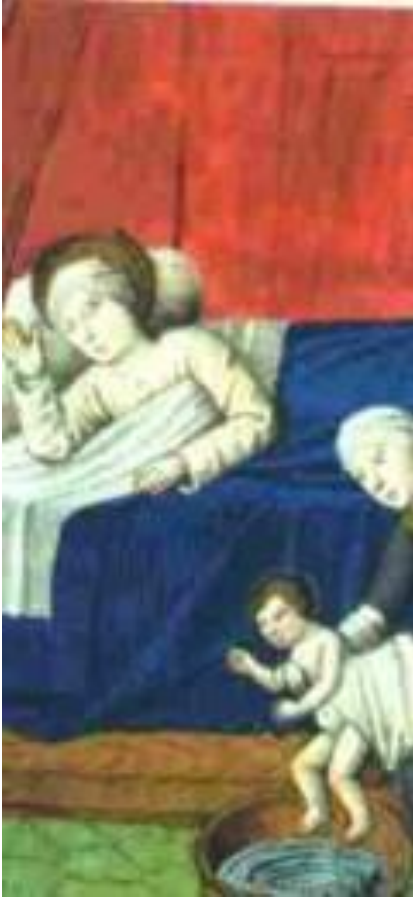
Рождество Богородицы, французская школа XV в.

Само их присутствие рассматривалось как неопровержимый и окончательный признак ереси. «Что среди них есть женщины, и они претендуют на то, чтобы проповедовать и отпускать грехи. Но это достойно осмеяния, потому что апостол Павел, наоборот...»