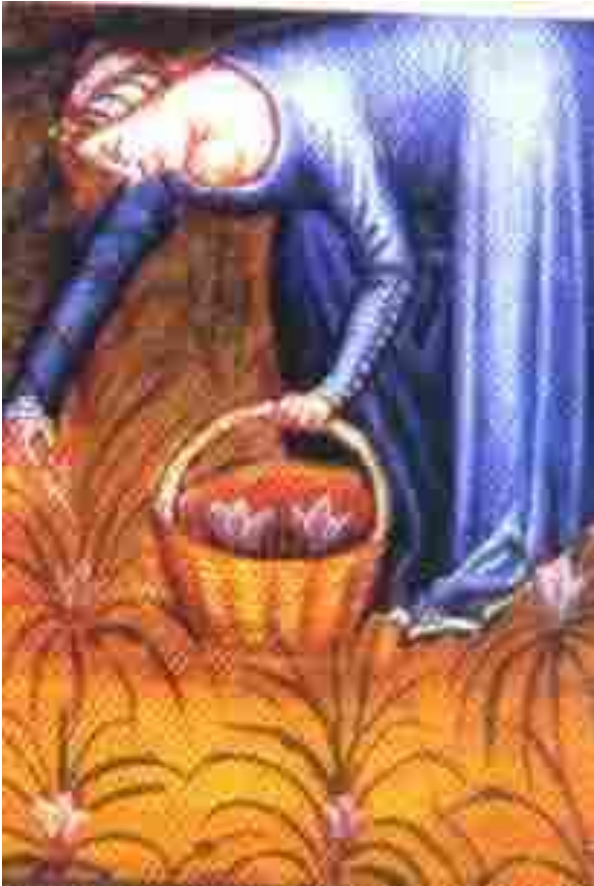
Tasunium Sanitatis: сбор фиалок, итальянская школа XIV в.

Крестовый поход против альбигойцев посеял ужас. В захваченных городах добрых мужчин и добрых женщин сотнями сжигали на кострах. Их христианское мученичество удвоило рвение верующих: во время короткой окситанской реконквисты (1218-1225 гг.) - между поражением Монфора и вступлением в войну короля Франции - множились призывания, разбитые Церкви были восстановлены, дома добрых женщин восстали из пепла. Но Парижский трактат 1229 года стал поражением графа Тулузского и южных феодалов. Оказавшись без поддержки, весь катарский клир, епископы, диаконы, добрые мужчины и добрые женщины , ушли в подполье. Но очень долгое время их защищали и охраняли ревностные верующие.